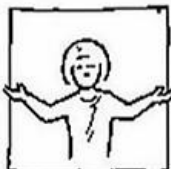
uw rijk kome