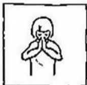
uw naam worde geheiligd