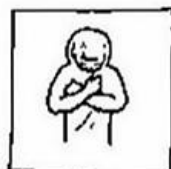
en vergeef ons onze schulden