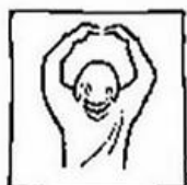
tot in eeuwigheid. Amen