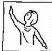
op aarde zoals in de hemel