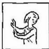
en breng ons niet in beproeving