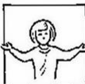
Want van u is het koninkrijk