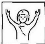
Onze Vader die in de hemel zijt