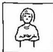
Geef ons heden ons dagelijks brood