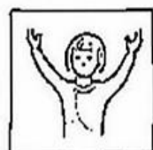
en de kracht en de eeuwigheid