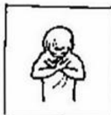
uw wil geschiede