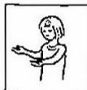
zoals ook wij vergeven aan onze schuldenaren