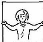
Want van u is het koninkrijk