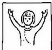
en de kracht en de eeuwigheid