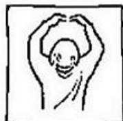
tot in eeuwigheid. Amen