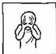
maar verlos ons van het kwade